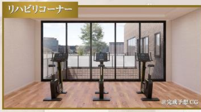
吹き抜けを通してダイニングまで見通せるリハビリコーナーで、ちくさ病院の専門職からリハビリを受けることができます。※医師の指示のもとで行います。