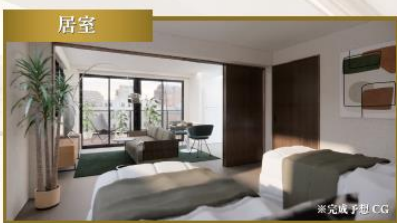
朝、カーテンを開ければ窓から注ぎ込む柔らかな陽光が気持ちの良い目覚めを促します。