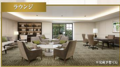
同じ時代を共有し、豊かな生活に迫り着いた方々が過ごすつづぎの空間です。