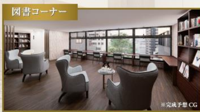
夕食後はどこからともなく聞こえる緩やかな音色に身を任せながら、読みかけの本を片手に耽美にふける時を。